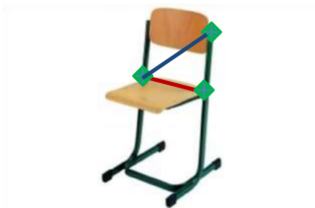
Obr. Židle se znázorněním vedení „pásů“ – popruhu. Zeleně znázorněná část je místo, kde je zapotřebí pás upevnit, např. provlečením apod.

Instruktor pomalu naklání židličku směrem vpřed. Židle se naklání až do okamžiku, kdy se židle stojí jen na předních nohách. Pokud instruktor dobře figuranta připevnil na „sedačku“, měl by zůstat sedět.